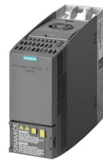
Иллюстрация аналогичная / Figure similar