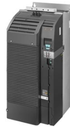
Иллюстрация аналогичная / Figure similar